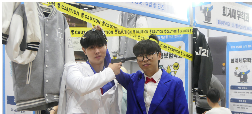
▲ JJ 신입생 Major Fair에서 코스프레를 하고 학과 홍보에 나선 재학생들

지난 4월 30일, 오후 1시부터 6시까지 스타센터 컨벤션센터 지하 1층 하림미션홀에서 'JJ 신입생 Major Fair' 행사가 진행됐다. 이번 행사는 올해 신설된 전공 자율 선택제 시행에 따라, 학생들의 전공 선택권을 보장하고 학과 탐색을 돕기 위해 기획됐다. 이번 전공 박람회는 2학기에 전공을 선택하게 되는 인문콘텐츠대학, 경영대학, 자유전공학부 2025학년도 신입생은 물론, 전공을 희망하는 모든 재학생을 대상으로 열렸다.