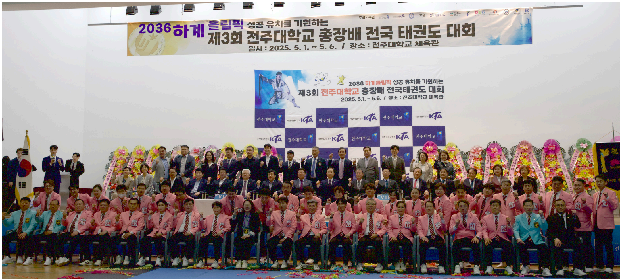
▲ 5월 1일부터 6일까지 진행된 총장배 태권도대회