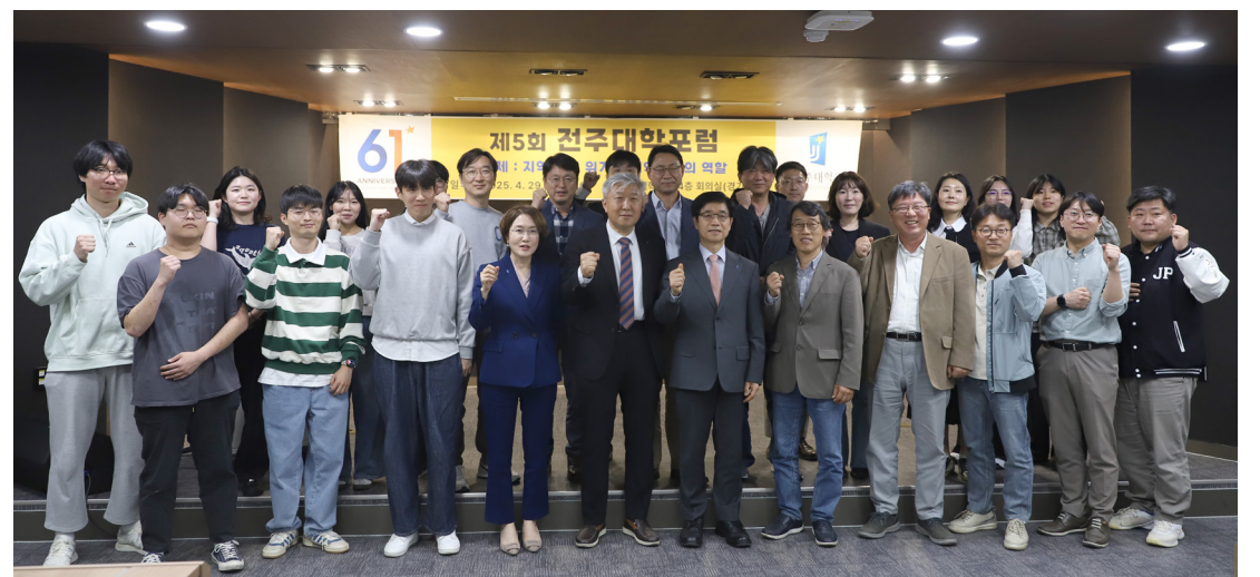
▲ 성황리에 마무리된 제5회 전주대학포럼 (사진 | 김예진 기자)

끝으로 한국 학생들의 일본 취업 사례를 예시로 들어 외국인 유학생을 적극 유치