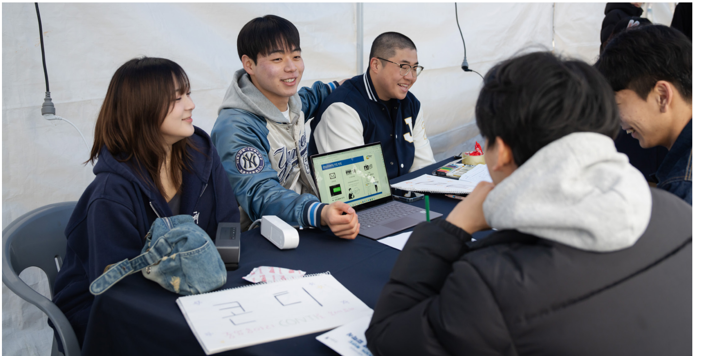
▲ 학술동아리 '콘티' 부스 운영 사진

는 스탬프 투어와 순간의 포착 이벤트를 준비했다. 스탬프 투어는 지정된 부스를 체험하고 스탬프를 받는 방식으로 진행됐으며, 4개 이상 스탬프 획득 시 교내 카페 쿠폰과 응모권 1장, 5개 이상 획득 시 교내 카페 쿠폰과 응모권 1장에 더해 전주대학교 굿즈와 푸드트럭 교환권을 증정했다. 6개 이상 획득 시 교내 카페 쿠폰과 응모권 2장을 증정했다. 응모권을 모은 학생들은 추첨을 통해 레노버 씽크패드, LG 울트라 PC 노트북 등 푸짐한 상품을 받을 기회를 가졌다.