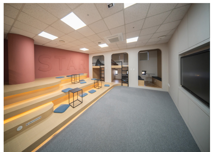
▲ 컴퓨터 센터 2층 대학일자리플러스센터 좌측 공간 사진, 대외협력홍보실 제공