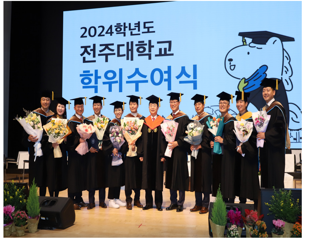
▲ 학위수여식 사진