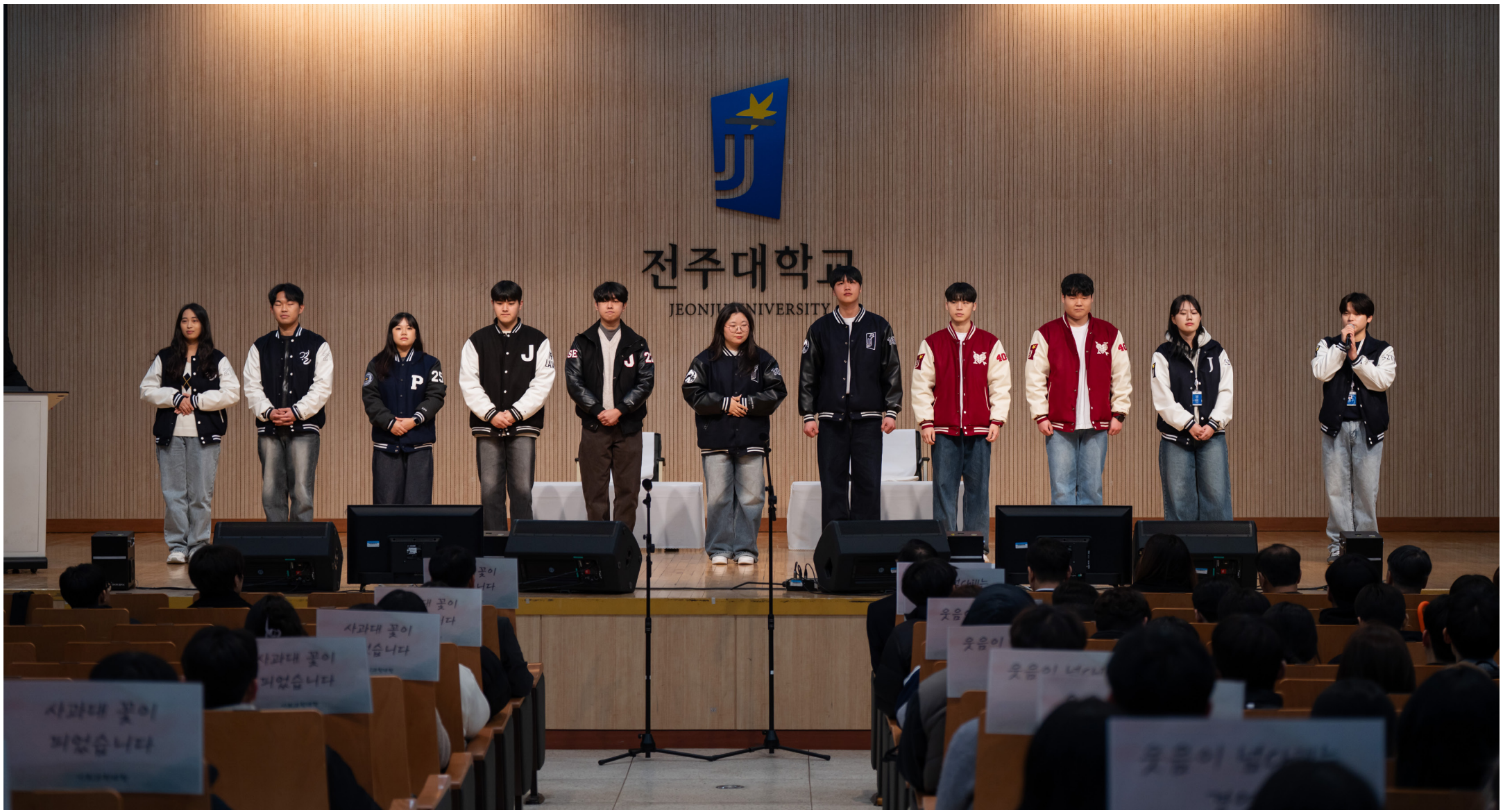
▲2025학년도 신입입생 입학식 사진, 대외협력홍보실 제공