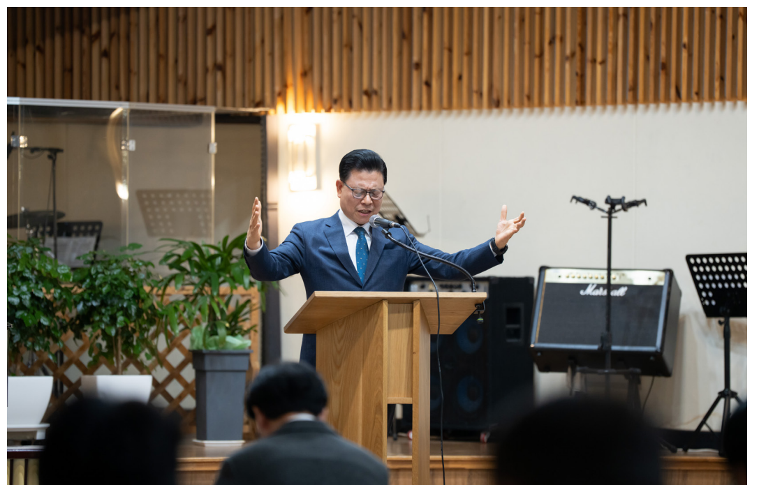
▲개강예배 사진