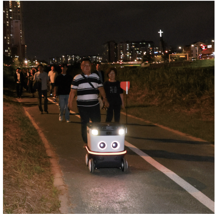
▲ 전주 천변을 순찰하는 자율순찰로봇

자율로봇은 이미 배달, 서빙, 안내 등 다양한 기능을 수행하고 있다. 공항에서 로봇이 짐을 들어주고, 식당에서 서빙을 하는 모습은 익숙한 풍경이 되었다. 이를 치안에도 적용한다면 경찰 인력 부족의 문제를 해결하고, 시민들이 안심하고 생활할 수 있는 환경을 조성할 수 있다. 이번 시연을 통해 성능을 입증한 자율순찰로봇은 현재는 제한된 범죄 상황에 대해 학습하고 있으나, 과거 범죄 사례를 바탕으로 다양한 시나리오를 구성해 점차 학습 범위를 넓혀나갈 예정이다. 이를 통해 순찰 과정에서 로봇이 다양한 상황을 정확히 인지하고, 경찰에게 신속히 상황을 전달할 수 있도록 활발한 연구가 진행되고 있다.