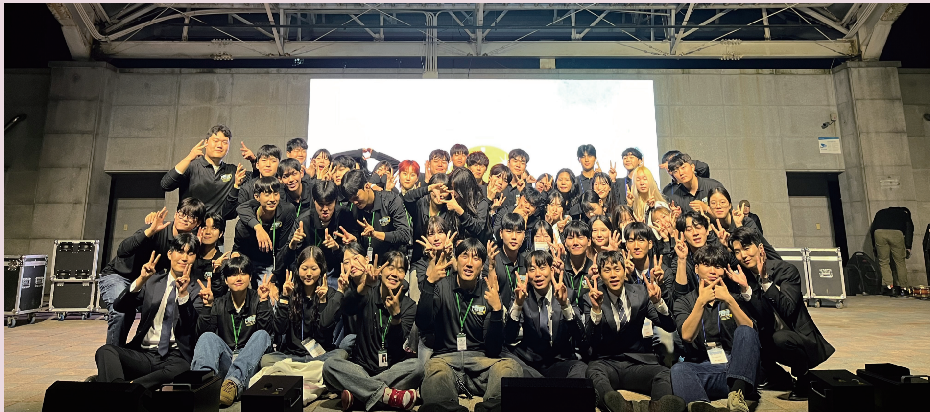
▲ 중동제 전체스태프

기사 | 김주은 기자(202315018@jj.ac.kr) 디자인 | 강수아 기자(xv0915@jj.ac.kr)