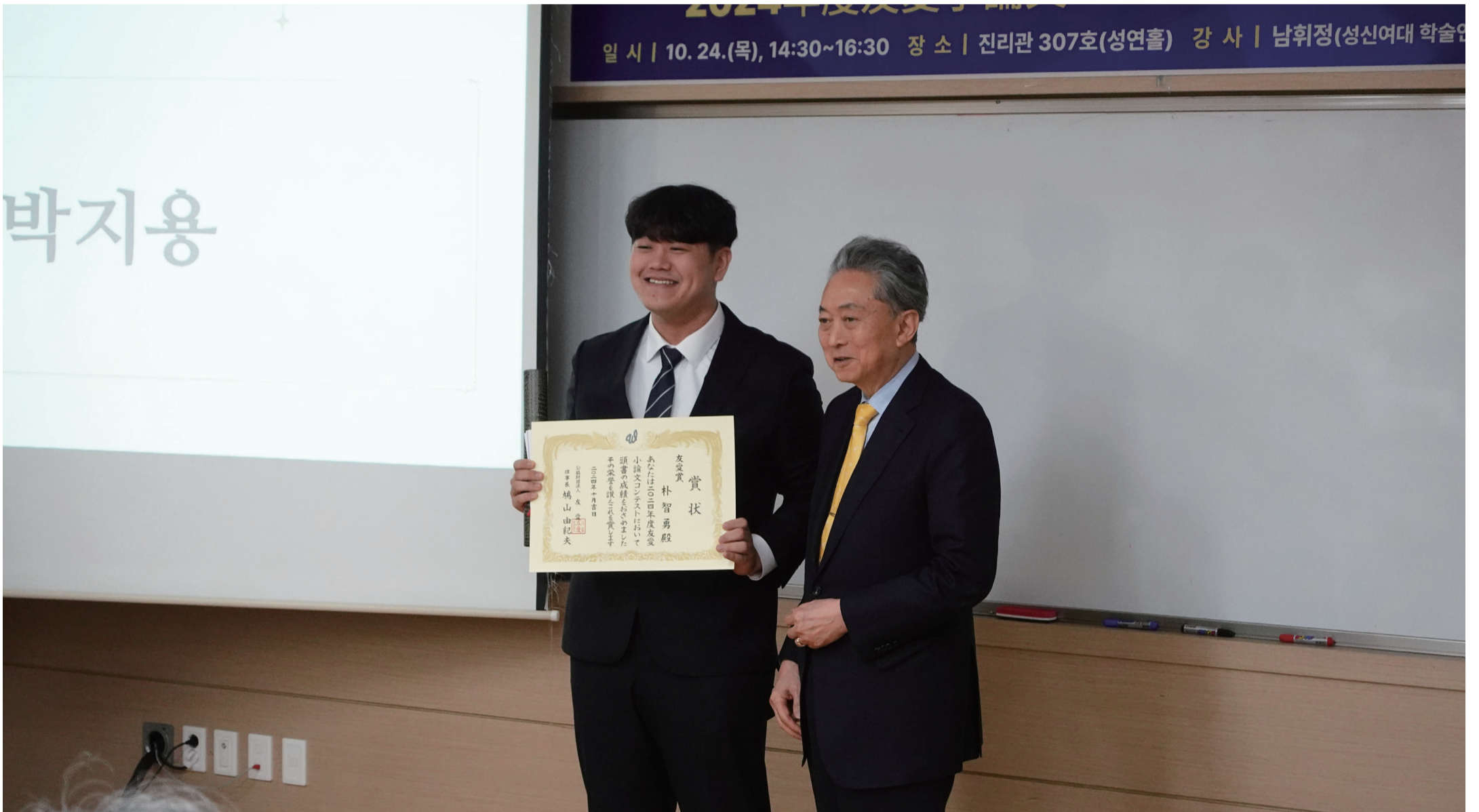
▲ 소논문 콘테스트 시상식에서 대상을 받은 박지용 학생에게 상장을 수여하는 하토야마 전 총리의 모습