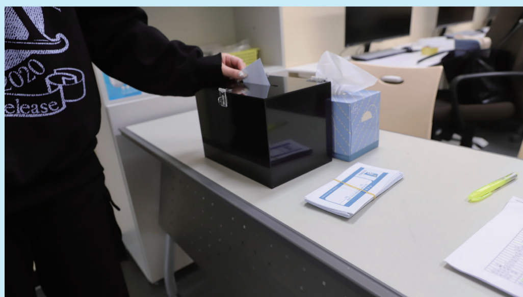
▲ 중앙동아리연합회 보궐 선거에 투표하고 있는 모습이다.

보궐선거 출마 선거본부 전체 당선을 끝으로 구성이 완료된 2024학년도 학생자치기구단은 향후 약 1년간 각 학생자치기구 소속 부서의 학생들을 위해 봉사한다. 이번 보궐선거에서 각자의 방식으로 참여민주주의를 실천한 학우들이 지난 5일~6일 사전투표와 4월 10일 선거일 투표로 진행된 제22대 국회의원선거에도 관심을 갖고 적극 참여했길 바란다.