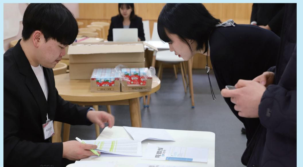
▲ 소프트웨어융합대학 보궐 선거 안내를 듣고 있는 모습이다.

기사 | 이견우 기자(virtuoso@jj.ac.kr) 디자인 | 이수용 기자(yong5135@jj.ac.kr)