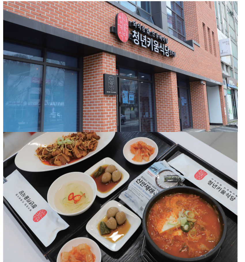
▲ '청년키움식당'의 외부 모습과 주 메뉴이다.