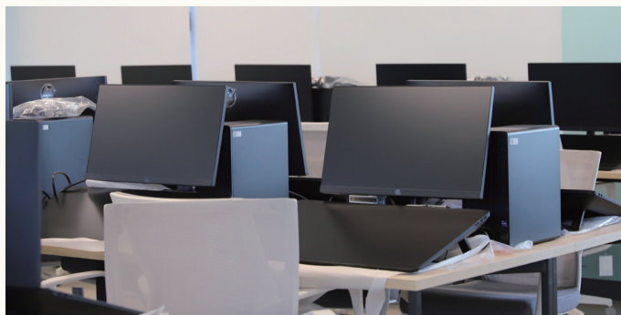
▲ 웹툰만화콘텐츠학과 제작 스튜디오(진리관 408호)

A. 이번에 새로 개설돼서 조금 낯설기도 하고, 2학년 선배들이 없어서 당황스럽고 불안할 수도 있는데, 그만큼 학교에서 교수들이 더 챙겨주고 아끼고 있으니 걱정하지 말고 준비한 강의를 즐겁게 배우시면 좋겠습니다. 이미 누군가 닦아놓은 길도 편하고 좋을 수 있지만, 새로운 길을 가보는 맛도 좋으니까요. 선구자나 개척자의 마음으로 함께 해나가면 좋겠습니다.